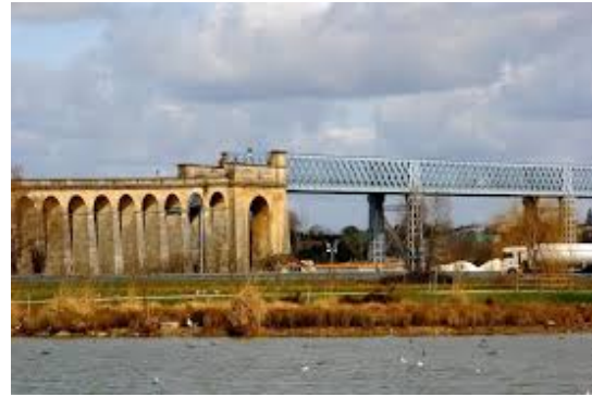
Article réalisé par copie de l'étude publique des travaux de réhabilitation de ce pont par le département de la Gironde