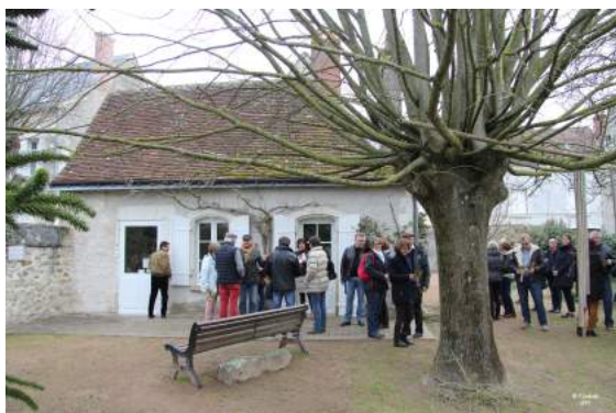
La Maison de Descartes