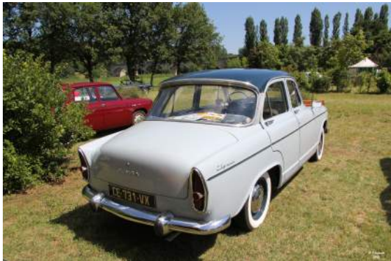
Simca P60 Elysée