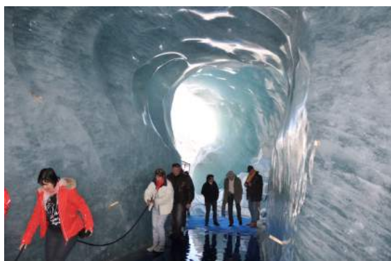
Dans le Glacier

Reprise du trajet pour rejoindre Chamonix et la gare de Montenvers avec son petit train pour la visite de la mer de glace.