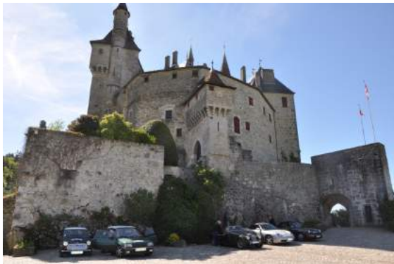
Château de Menthon St Bernard Après la visite direction Annecy pour une promenade en bateau sur le lac.

Vendredi 6 mai : départ pour Annecy, en passant par Bonneville, Saint Sixt, le col des Fleuries, Avernioz, Annecy le Vieux et visite du Château de Menthon Saint Bernard.