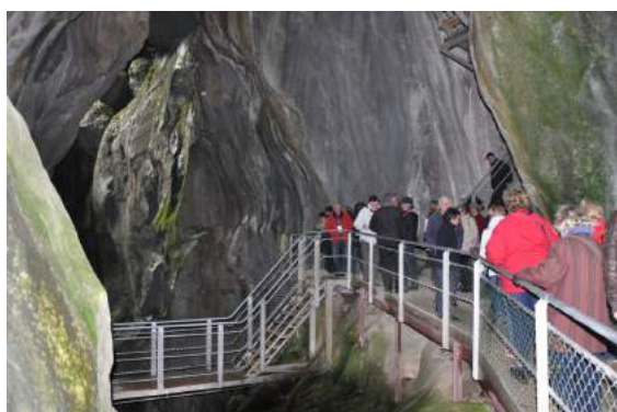
Ici la visite des gorges du pont du Diable

Notre joyeuse bande reprend ensuite la route pour rejoindre le superbe village d'Yvoire en passant par Evian Les Bains, Thonon les Bains.