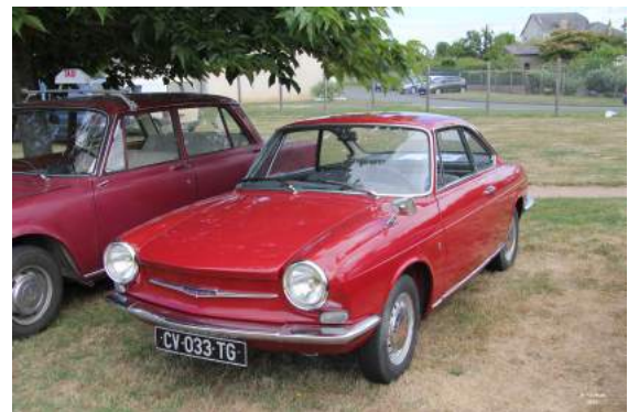
Simca Coupé Bertone

1963 : Sortie du coupé Simca 1000 Bertone et des Simca 1300 et 1500.