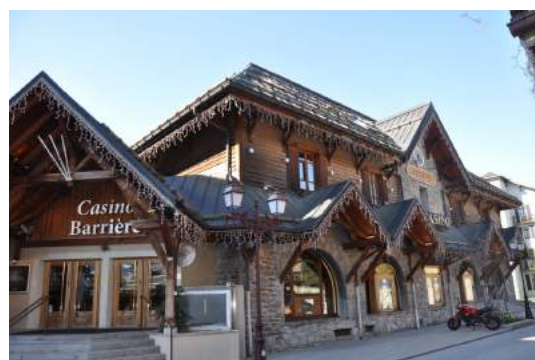
Megève, Le Casino

Puis le col de la Forclaz, Les Saisies et Megève pour une promenade dans le centre ville.