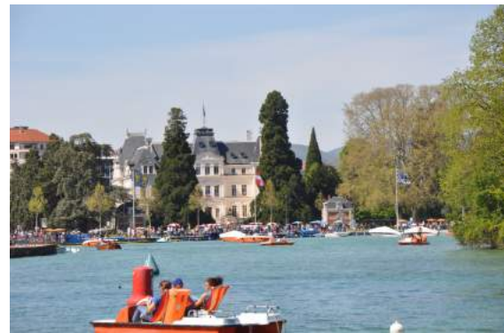
Annecy vue du lac

Reprise de la route pour le retour et la dernière soirée à l'hôtel en passant par Argonnay, Charvonnex, Vougy, Châtillon et enfin Samoëns.