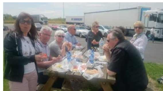
Détente avant le retour

Reprise de la route pour le retour et la dernière soirée à l'hôtel en passant par Argonnay, Charvonnex, Vougy, Châtillon et enfin Samoëns.