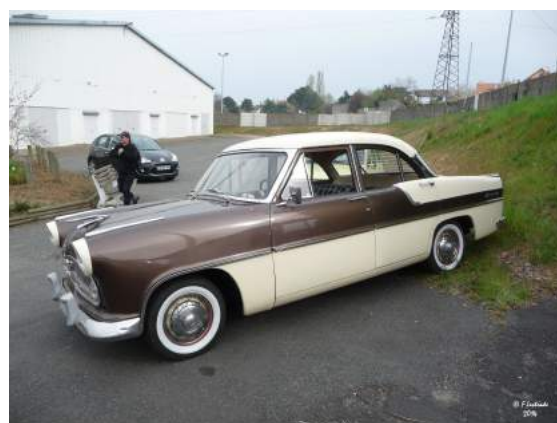
1957 : Simca Ariane