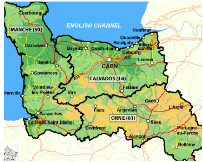
Le Mont St Michel