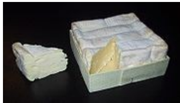
Le Pont l'évêque