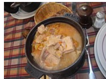
Les Tripes à la mode Caen