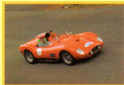
Reconstruite à 6 exemplaires, cette barquette est une Ferrari motorisée par le 6 cylindres Dino