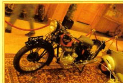
L'une des quelques motos en exposition dans le Hall de l'hôtel Nordic.