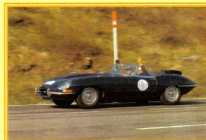
Une Jaguar Type E dans le col de Puvmorens